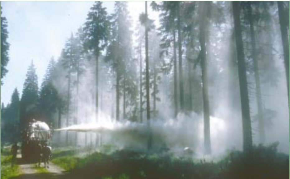
Abbildung 8: Kalkausbringung durch Verblasung