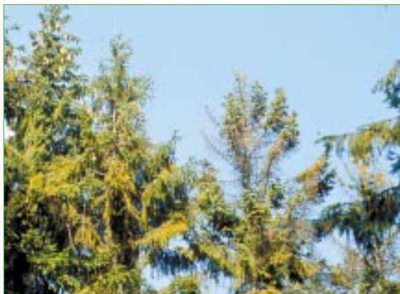
Abbildung 4: Neuartige Waldschäden im Böhmerwald: Nadelvergilbung infolge Magnesiummangel, Triebsterben durch Pilzbefall

Auftreten von unterschiedlichen Schadursachen erschwert eine eindeutige Zuordnung.